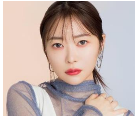
Grege Quartz グレイジュクォーツ