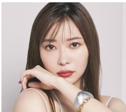
Twin Topaz ツイントパーズ