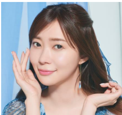
Crystal Bloom クリスタルブルーム