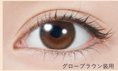
グローブラウン着用