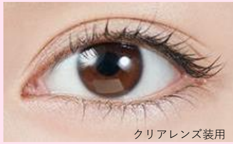
クリアレンズ着用