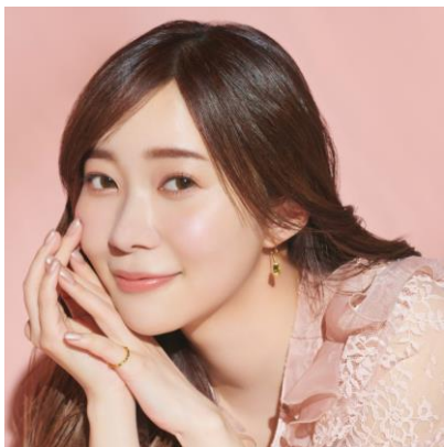
Rutilated Drop ルチルドロップ