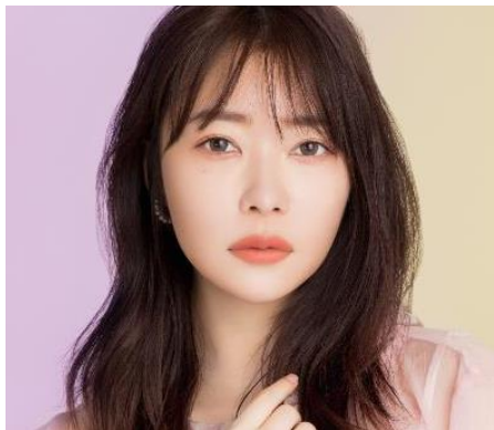
Pearl Cats Eye パールキャッツアイ