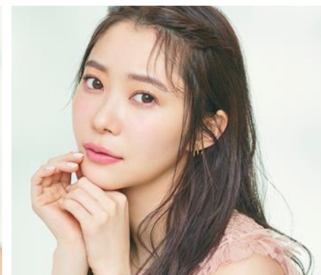
Strawberry Quartz ストロベリークォーツ