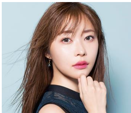
Lapis Lazuli ラピスラズリ