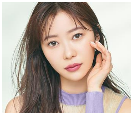
Date Topaz デートトパーズ