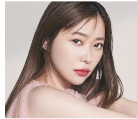
Smoky Quartz スモーキークォーツ